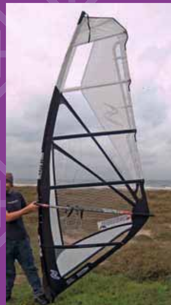
Ezzy SE wave